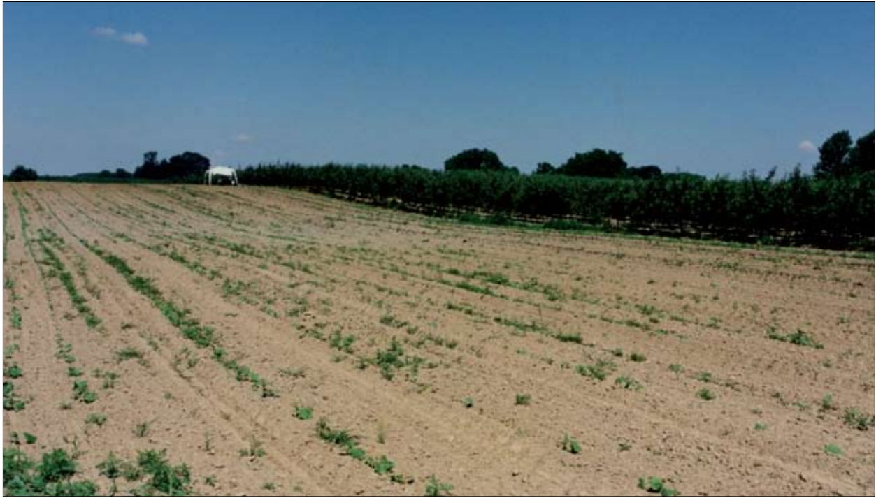
Sl. 1: pogled na nalazište tijekom istraživanja 1998. godine / Fig. 1: a view on the site during the 1998 excavation

prikupljenom brojnom i raznovrsnom materijalnom ostavštinom, od iznimne važnosti u prepoznavanju vrste te kontakata ostvarenih sa susjednim zajednicama, od kojih je većina keltskog porijekla, ali i s autohtonim panonskim stanovništvom čija je ostavština, kako je već istaknuto, najvećim dijelom bila latenizirana, no koje je ipak zadržalo pojedine vlastite tekovine. 7 Isto tako, istraživanja omogućavaju proučavanje duhovnog naslijeđa i pogrebnih običaja nekadašnjih stanovnika Zvonimirova, a što će osnažiti usporedbe s rezultatima istraživanja groblja na širem jugoistočnoalpskom i južnapanonskom području. Analizom rasporeda i broja grobnih priloga otvaraju se mogućnosti proučavanja društvene strukture zajednice, ako se pretpostavi kako se u broju i kvaliteti priloga u grobovima zrcali nekadašnji status i uloga u društvu preminulog pojedinca. S druge strane, tipološko proučavanje nalaza s groblja u Zvonimirovu, uz usporedbe s prostorno bliskim nalazištima, omogućit će prepoznavanje posebnosti razvoja materijalnog naslijeđa te stvaranje jedinstvene kronološke slike razvoja latenske kulture u Podravini.